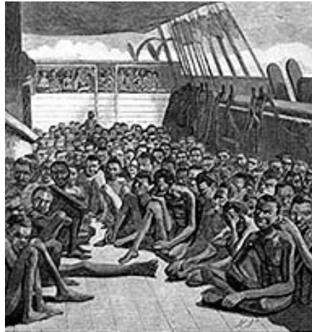
Billede: Harper's Weekly (June 2, 1860) - The Slave Deck on the Bark 'Wildfire,' 1860. http://hitchcock.itc.virginia.edu/Slavery/search.html